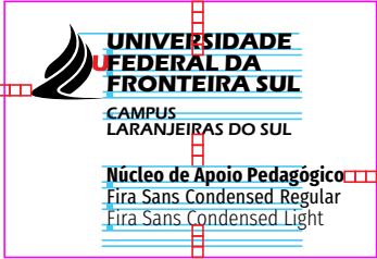
Modelo do MIV